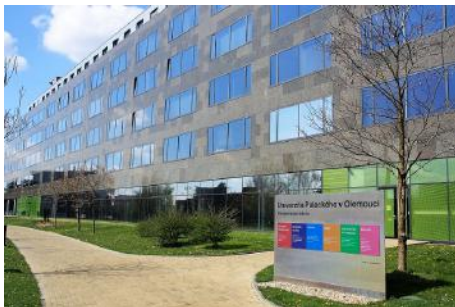
Zgradba Naravoslovne fakultete Palackyjeve univerze v Olomoucu, v kateri domuje Oddelk za geografijo.