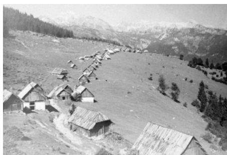
Planina Zajamniki, Bohinj.

vrsti fotografskega materiala, naslovu posnetka, datumu opravljenega posnetka, šifri lokacije in tematike ter opombe. Gradivo se je ločilo na štiri glavne tematike: pokrajina, naselja, dom ali hiša, sestavine kulturne pokrajine (oziroma etnološkega značaja). Katalog nam je bil v pomoč, ko smo se leta 2017 odločili za digitalizacijo negativov na steklu. Do ideje za digitalizacijo je prišlo zato, ker knjižnica nima ustreznih aparatov za pregledovanje takšnega gradiva, ker se na ta način gradivo ohrani in navsezadnje, ker je bil s tem širši javnosti omogočen vpogled v zbirko.