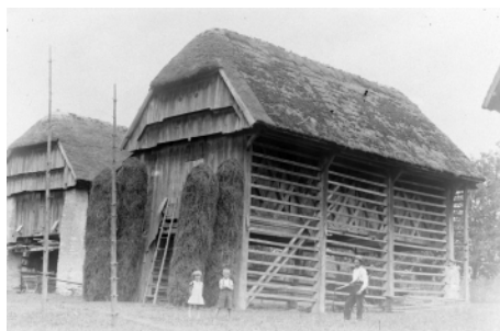
Vezani kozolec, Loški potok.

Negative na steklu je bilo potrebno poskenirati s skenerjem, ki s posebnim ozadjem omogoča primerno osvetlitev, tako da smo dobili čim boljše fotografijo. Nekaj negativov pa nam je uspelo digitalizirati s pomočjo fotoaparata. Dobili smo 377 fotografij ustrezne kakovosti, za katere smo se odločili, da jih objavimo na Kamri. Kamra je regijski portal, kjer se objavljajo digitalizirane vsebine s področja domoznastva iz knjižnic in drugih lokalnih kulturnih ustanov. Vsebine, ki je objavljena na Kamri, je dostopna tudi v evropski digitalni knjižnici Europeana.