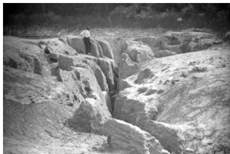
Cerkniško jezero - požiralnik Velika Bobnarica.

V arhivu Oddelka za geografijo, natančneje takratnega kartografskega laboratorija, se je do devetdesetih let prejšnjega stoletja hranila obsežna zbirka negativov na steklu. Kako je Oddelek negative dobil in kdo jih je daroval, ni točno znano. Predvidevamo pa, da so bili last Antona Melika, ker je kar nekaj fotografij objavljenih v njegovih monografijah. Ob preureditvi kartografskega laboratorija je zbirka prišla v hrambo knjižnice, ki je negative shranila v kartografsko zbirko. Shranjeni so v posebnih škatlah, vsak je v ovitku iz paus papirja, na katerem so podatki o zaporedni številki, vsebini in času nastanka fotografije. Negativi so bili najprej popisani v Katalogu starih fotografij, kjer so določene že tudi kategorije oziroma tematski sklop negativa. Zbirka vsebuje 454 negativov, nastali so v tridesetih letih prejšnjega stoletja.