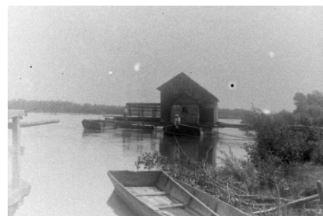
Mlin na Muri pri vasi Mota.

Mestno knjižnico Ljubljana, ki je upraviteljica zbirke za knjižnice ljubljanske regije. Po dogovoru z regijsko urednico smo fotografije opremili z metapodatki, ki so vsebovali podatke o naslovu, letnici nastanka, geografskih ključnih besedah in ključnih besedah, ki jih uporablja Kamra. Fotografijam smo dodali še oznako najbližje poštne številke, ker se na podlagi te izriše približna lokacija na zemljevidu Kamre. Negative oziroma fotografije smo razdelili na 13 sklopov: Alpske pokrajine, Avstrijska Koroška, Dinarskokraške pokrajine, Ekskurzije študentov Oddelka za geografijo, Geomorfološke oblike, Kozolci, Kras, Ljubljansko barje, Naselja, Planine, Pomurje, Predalpske pokrajine, Stavbna dediščina. Sklope smo opremili s kratkimi opisi, predstojnik Oddelka za geografijo D. Ogrin pa je prispeval uvodno besedilo z naslovom Uporaba slikovnega gradiva kot vira v geografiji.