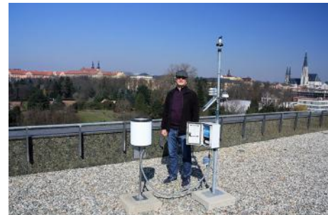
Mezometeorološka postaja na strehi Naravoslovne fakultete.

termalnega snemanja površja se je maja 2017 udeležil tudi dr. Vysoudil. S kolegom Vysoudilom sva v nadaljevanju obiska usklajevala še podrobnosti o izdelavi topoklimatske karte Loškega potoka ter pripravila izhodišča in osnovno gradivo za skupen članek o termalnemu snemanju Zemljinega površja za potrebe izdelave topoklimatskih študij v Sloveniji in na Moravskem.