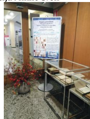
Spletni katalog pomembnejših del si lahko ogledate na spletni strani oddelka..