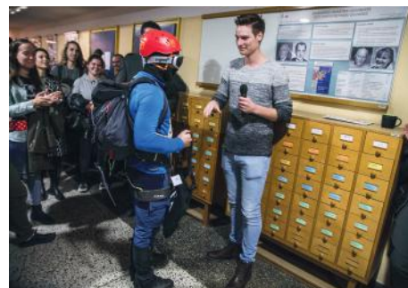
Utrinki iz 18. geografske čajanke