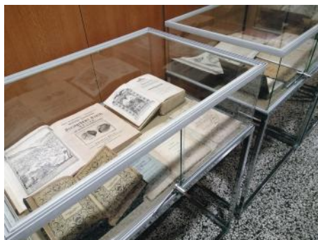
Razstava pomembnejših del knjižnice oddelka.

V okviru dogodkov obeleženja stoletnice Oddelka za geografijo je knjižnica pripravila razstavo pomembnih del, ki so bila izdana do leta 1960. Otvoritev razstave je bila v petek, 20. 9. 2019, ko je na oddelku potekal t.i. Geografski mozaik.