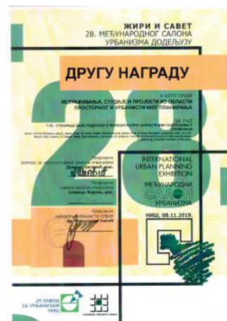
2. nagrada na mednarodni urbanistični razstavi v Nišu