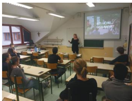
Biti ali ne biti ... učitelj geografije? Predstavitev študija geografije na Gimnaziji Želimlje, 26. november 2019.

Oddelak za geografijo si že nekaj let prizadeva navdušiti srednješolce za (prvostopenjski) študij geografije, posebno na srednjih šolah, od koder je že do sedaj na študij geografije prišlo veliko študentov, pa tudi na šolah, iz katerih bi si na Oddelku želeli več kandidatov. Promocija študija geografije, pri katerih sodelujejo sodelavci Oddelka in študenti, poteka na tri načine: z dnevi odprtih vrat, ko zainteresirani dijaki obišejo Oddelak, s predstavitvijo študija geografije na srednjih šolah ter z aktivno udeležbo na kariernih dnevih. Ključni elementi predstavitev so osnovne informacije o Oddelku, sestava predmetnika, način študija (s poudarkom na mednarodnih izmenjavah in terenskih vajah) ter možnosti za zaposlitev. Študenti na predstavitev dodajo svoj vidik študija geografije ter predstavijo bogato obštudijsko delovanje (Društvo mladih geografov Slovenije, tutorstvo, delovanje Študentskega sveta).