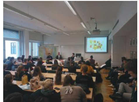
V okviru gostovanja smo na oddelku izvedli tri predavanja.

volitev in njihovem vplivu na razplet volitev leta 2020.