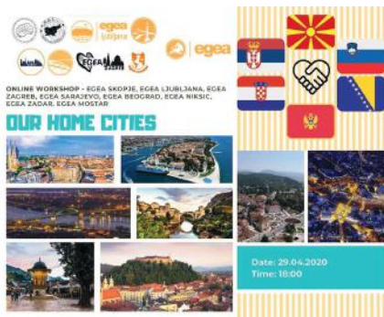
Delavnica "Our home cities" je povezala študente geografije iz šestih držav.

Emerald Premier je zbirka vseh naročniških revij založbe Emerald Publishing. Vsebuje 308 revij z različnih področij, med njimi tudi geografije. Geografske revije, ki jih zbirka vsebuje, so npr. International Journal of Sustainability in Higher Education, International Journal of Climate Change Strategies and Management, International Journal of Culture, Tourism and Hospitality Research, International Journal of To-