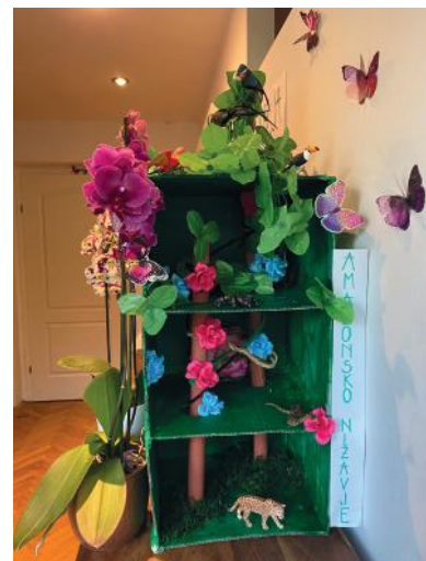
Sodelovanje v oddaji Izodrom – maketa tropskega deževnega gozda.

V oddaji, ki je bila 14. maja 2020 posvečena živalskim vrstam, pa smo pripravili vsebine, povezane z življenjskimi okolji živalskih vrst in najmlajše popeljali v Amazonsko nižavje, kjer so s pomočjo makete spoznavali vertikalno razporeditev rastlinskih in živalskih vrst tropskih deževnih gozdov, pa tudi na Antarktiko, kjer smo najmlajšim predstavili nekaj značilnih živalskih vrst Antarktike.