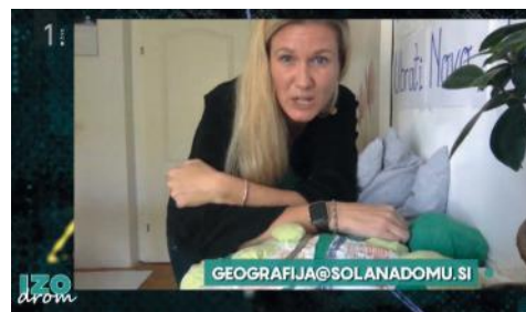
Sodelovanje v oddaji Izodrom – predstavitev reliefnih oblik.

Na Katedri za didaktiko geografije pa v tem času nismo pozabili niti na najmlajše, saj smo za njih pripravili geografske izobraževalne vsebine v okviru dveh poučnih oddaj Izodrom, ki potekajo na televizijskem programu RTV SLO v dopoldanskem času. Ob dnevu Zemlje, 22. aprila 2020, smo pripravili poučne geografske vsebine z naslovom Planet Zemlja, kjer smo najmlajšim gledalcem v živo preko oddaje s pomočjo različnih didaktičnih učil predstavili nekaj zanimivih dejstev o Zemlji.