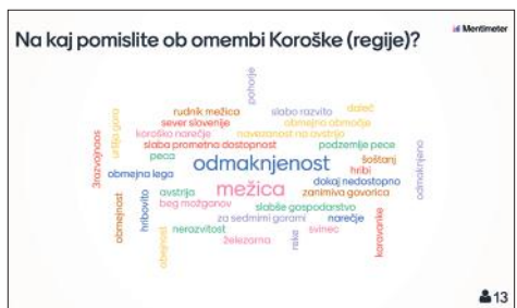
Mentimeter: Študentske misli o Koroški na začetku terenskih vaj.

ambasade v Ljubljani, temveč vsak v svojem domačem kotičku in se odpravili na pot. Najprej naju je zanimalo, na kaj študentje pomislijo ob omembi Koroške. Izkazalo se je, da smo vse njihove poglede ustrezno naslovili tudi v nadaljevanju terenskih vaj in so tako bili zelo smiselni.